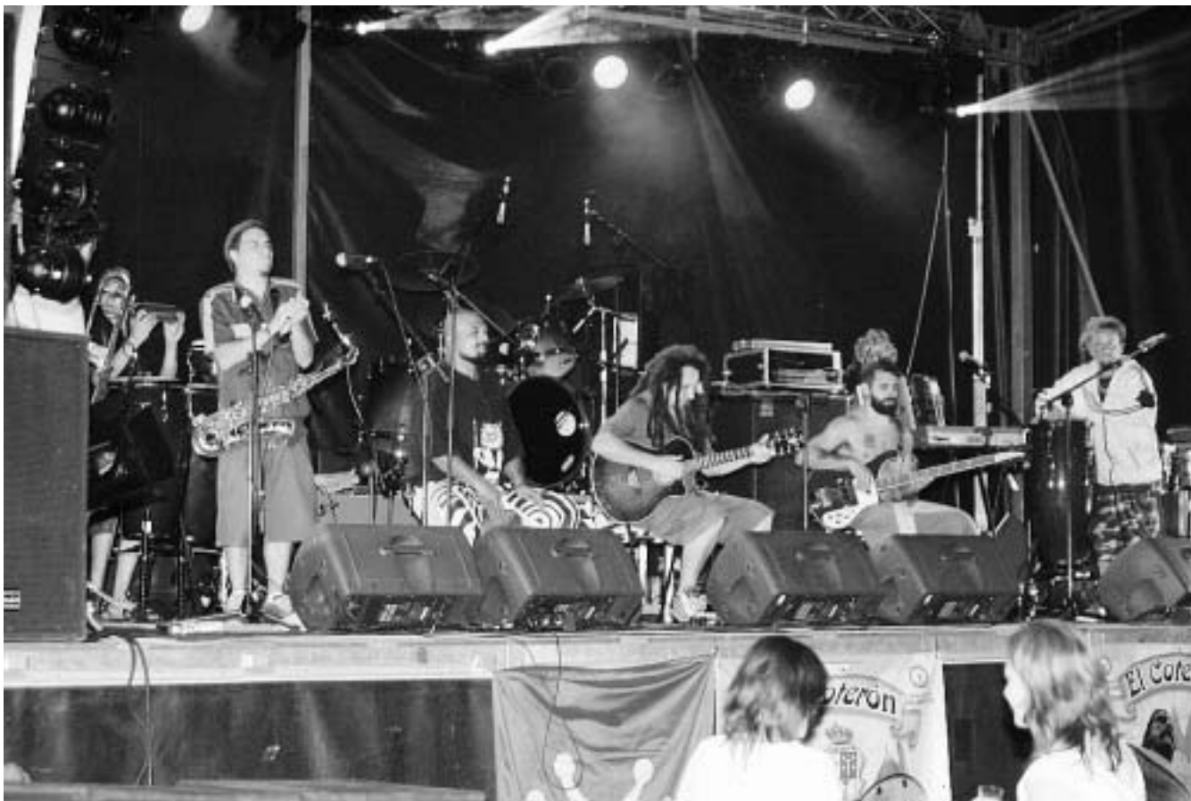
Un momento de la actuación del grupo argentino Karamelo Santo en la localidad lebaniega de Tama.