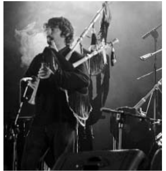
El gaitero del grupo Tejedor.

La noche del sábado fue de auténtico folk y rock en Tama, escenario de este festival, donde se concentró un expectante público de todas las edades que, bajo la gran carpa blanca que los organizadores dispusieron para la celebración de este evento musical, se entregó a los ritmos impuestos por Camerata Cervantina, los asturianos Tejedor y los cántabros, Los Trastolillos. El delirio musical llegó sobre las tres de la madrugada, cuando el grupo argentino Karamelo Santo puso sobre el escenario su rock particular, cargado de diferentes ritmos que provocó que la gente se animara y participara en esta